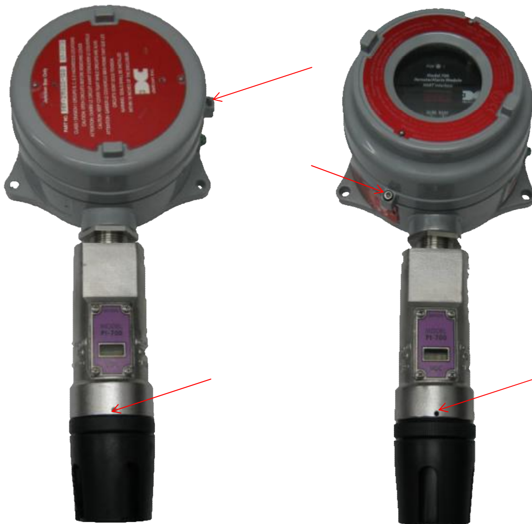
а) с соединительной коробкой (без дисплея)

Общий вид датчиков и места пломбирования от несанкционированного доступа приведены на рисунке 1.