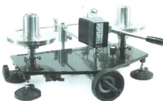
УСД специализированного исполнения