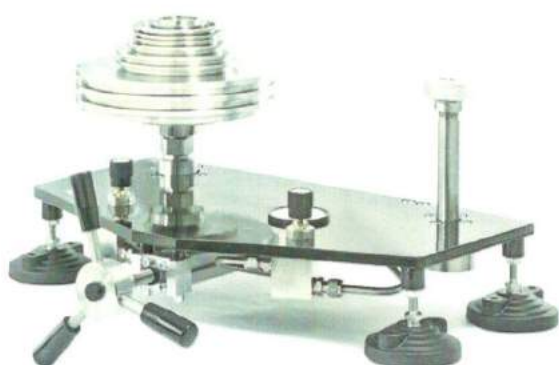
УСД обычного исполнения высокого давления