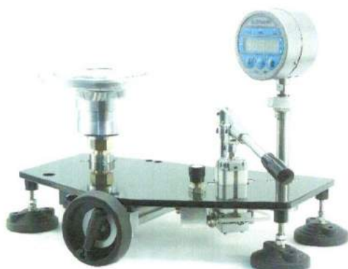
УСД обычного исполнения низкого давления