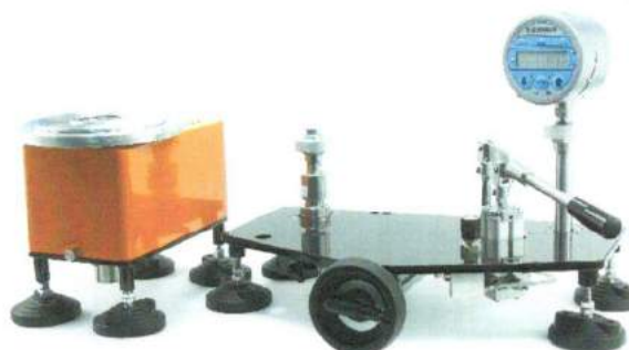
УСД обычного исполнения низкого давления и устройство принудительного вращения поршня для ИПС