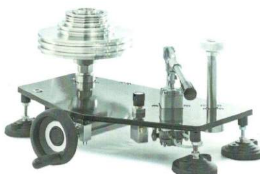
УСД обычного исполнения низкого давления